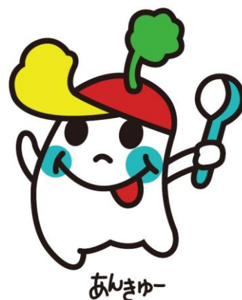
安城市学校給食協会 イメージキャラクター